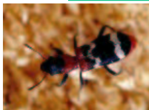
Thanasimus formicarius – Ameisenbuntkäfer