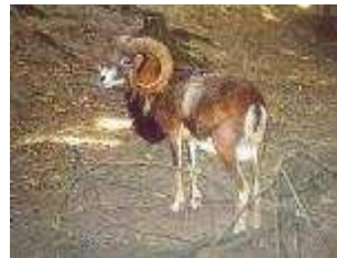
Europäisches Mufflon – Ovis ammon musimon