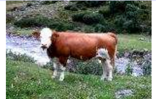
Bos primigenus domesticus – Europäisches Hausrind