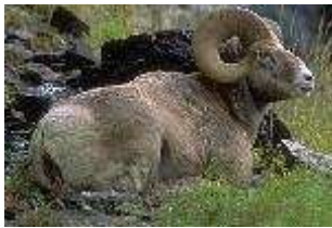
Dickhornschaf – Ovis canadensis