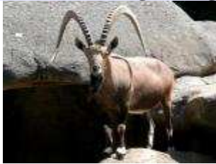
Nubischer Steinbock – Capra ibex nubiana