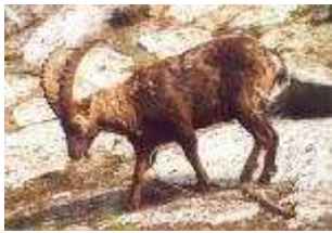
Alpensteinbock – Capra ibex ibex