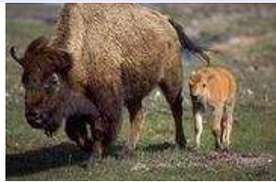
Bison bonasus – Wisent