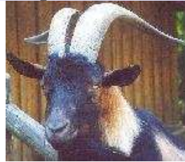
Hausziege – Capra hircus