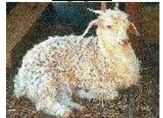
Hausschaf – Ovis ammon domesticus