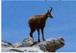
Gemse – Rupicapra rupicapra