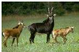
Pferdeantilope – Hippotragus equinus