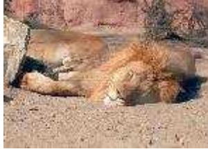
Löwe – Panthera leo