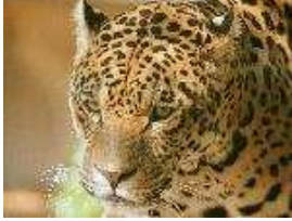
Jaguar – Panthera onca