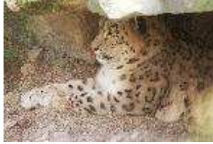
Schneeleopard – Uncia uncia