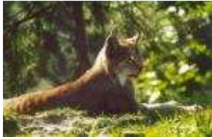
Luchs – Lynx lynx