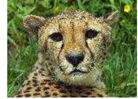
Gepard – Acionynx jubatus