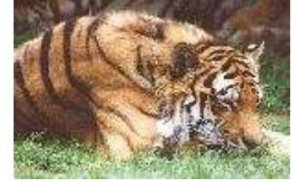
Tiger – Panthera tigris