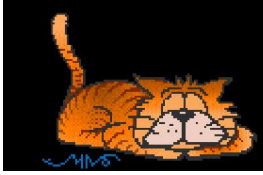
Haus- und Wildkatze – Felis silvestris + F. silvestris domestica