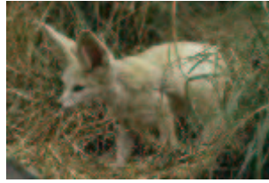
Fennek, Wüstenfuchs – Fennecus zerda