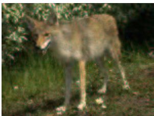
Kojote – Canis latrans