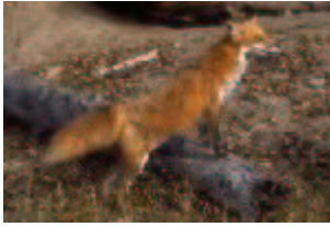
Rotfuchs – Vulpes vulpes