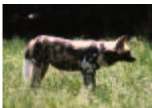
Afrikanischer Wildhund – Lycaon pictus