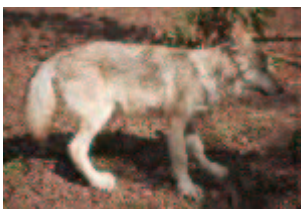
Europ. Wolf – Canis lupus lupus