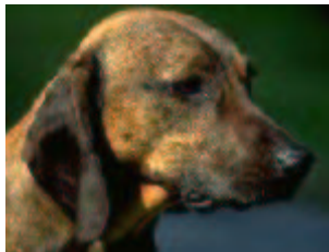
Hund – Canis lupus familiaris